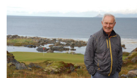
Lofoten-Links in Norwegen S. 20