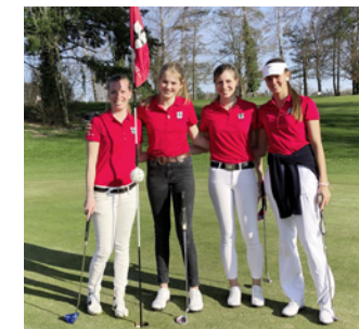
DGL Damen S. 24