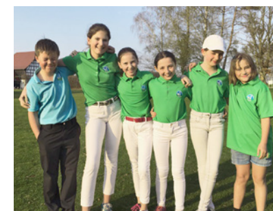
Förderkader 2019 S. 11