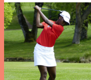
Ostervierer 2019 S. 4

BODENSEEFORUM KONSTANZ Reichenaustraße 21 78467 Konstanz +49 7531 12728-0 info@bodenseeforum-konstanz.de www.bodenseeforum-konstanz.de