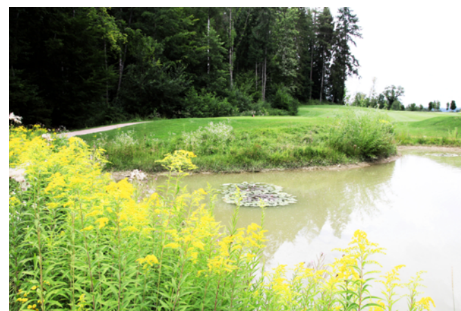
Auch hierfür ist der Golfclub ausgezeichnet worden: Er leistet auch mit natürlichen Teichen seinen Anteil an der Renaturierung