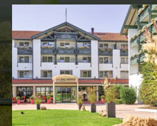
Hotel DAS LUDWIG *****

A. Hartl Resort GmbH & Co. Holding KG Thermalbadstraße 28 94086 Bad Griesbach Tel.: +49 (0) 8532/981-0 fuerstenhof@quellness-golf.com