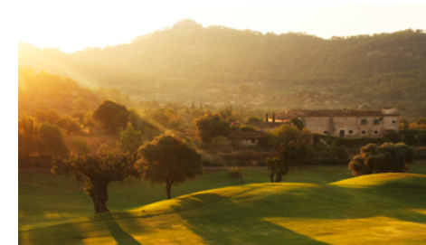
Mallorca S. 16