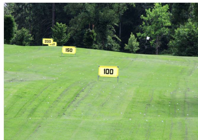
Driving Range nennt sich der Platz, an dem die Golfer den Abschlag perfektionieren

Seit dem Frühjahr 2019 läuft das BUND-Insektenprojekt „Konstanz summt“, das zum Ziel hat, mehr Lebensraum für Insekten in und um Konstanz zu schaffen und so dem Artensterben mit praktischen