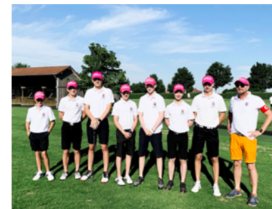
DMM Jungen 2019 S. 10