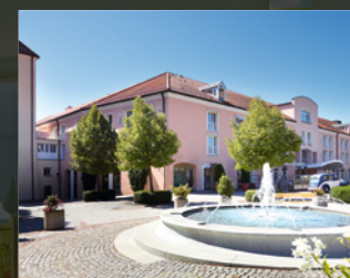
Hotel MAXIMILIAN *****

entfliehen, die typisch bayerische Gastlichkeit genießen, relaxen und Ihrem Körper die nötige Ruhe und Kraft geben. Grenzenloses Golfvergnügen für Golfer aller Altersklassen und Spielstärken erleben Sie in Europas Golf Resort Nr. 1 auf insgesamt 129 Spielbahnen. Es erwarten Sie u.a. fünf abwechslungsreiche 18-Loch-Meisterschaftsplätze, darunter auch der Beckenbauer Golf Course (2013-2017 Austragungsort der European Tour), die PGA Premium-Golfschule sowie ein prall gefüllter Turnierkalender.