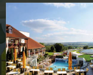
Hotel FÜRSTENHOF *****

A. Hartl Resort GmbH & Co. SH Land- und Golfhotel Betriebs KG Kurallee 1 94086 Bad Griesbach Tel.: +49 (0) 8532/795-0 maximilian@quellness-golf.com