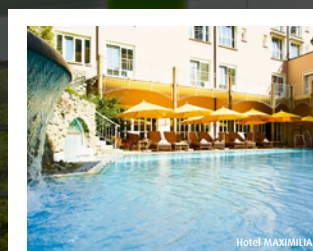
Hotel MAXIMILIAN *****

A. Hartl Resort GmbH & Co. Ferienhotel Griesbach Betriebs-KG Am Kurwald 2 94086 Bad Griesbach Tel.: +49 (0) 8532/799-0 dasludwig@quellness-golf.com