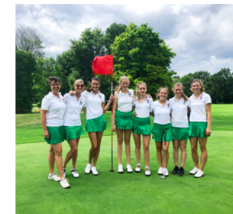
DGL Damen S. 28