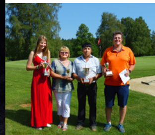
Clubmeisterschaft 2019 S. 9

Lago Shopping Center | 1. Floor | Bodanstrasse 1 | 78462 Konstanz Telefon +49 (0) 7531 69 10 877 | Öffnungszeiten Mo - Sa 9.30 - 20 Uhr Do 9.30 - 22 Uhr