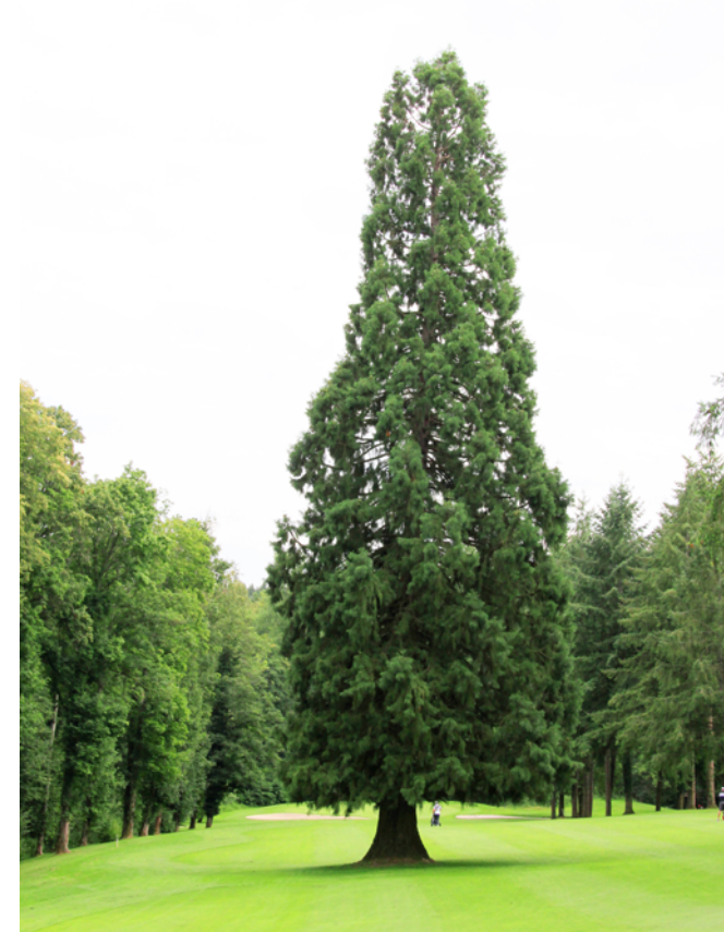
Dieser rund 100 Jahre alte Mammutbaum steht mitten auf einer Bahn

gewandelt. Wir haben auf unserem Platz zahlreiche Biotope, Naturteiche, Obstbäume oder Sumpfbiothope.“ Werner Schüle, der technische Vorstand, ergänzt: „Wir wollen unseren Sport unter Berücksichtigung der Natur und des Naturschutzes ausüben.